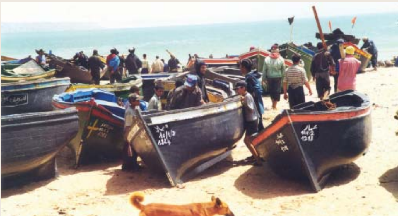
La pesca és una font de riquesa. Port de Bojdour.

tració, fins i tot el tracte al carrer per part de les autoritats, és molt diferent segons el bàndol amb què s'estigui identificat. Així, hi ha uns ciutadans que són considerats per les autoritats com els desitjables: els marroquins i els sahrauís promarrocs, i uns altres que poden ser objecte de qualsevol vulneració dels seus drets —ja que des de les mateixes autoritats es propugna aquesta actitud—: els no desitjables, els sahrauís que no accepten com a vàlida l'ocupació del Marroc.