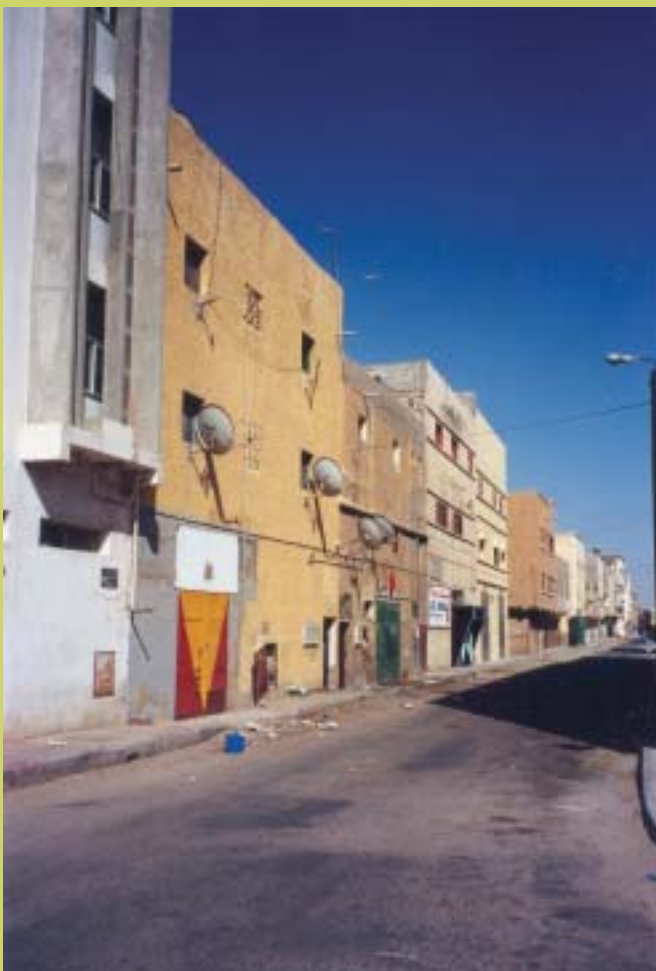
Les parabòliques omplen els carrers de l'Aiun