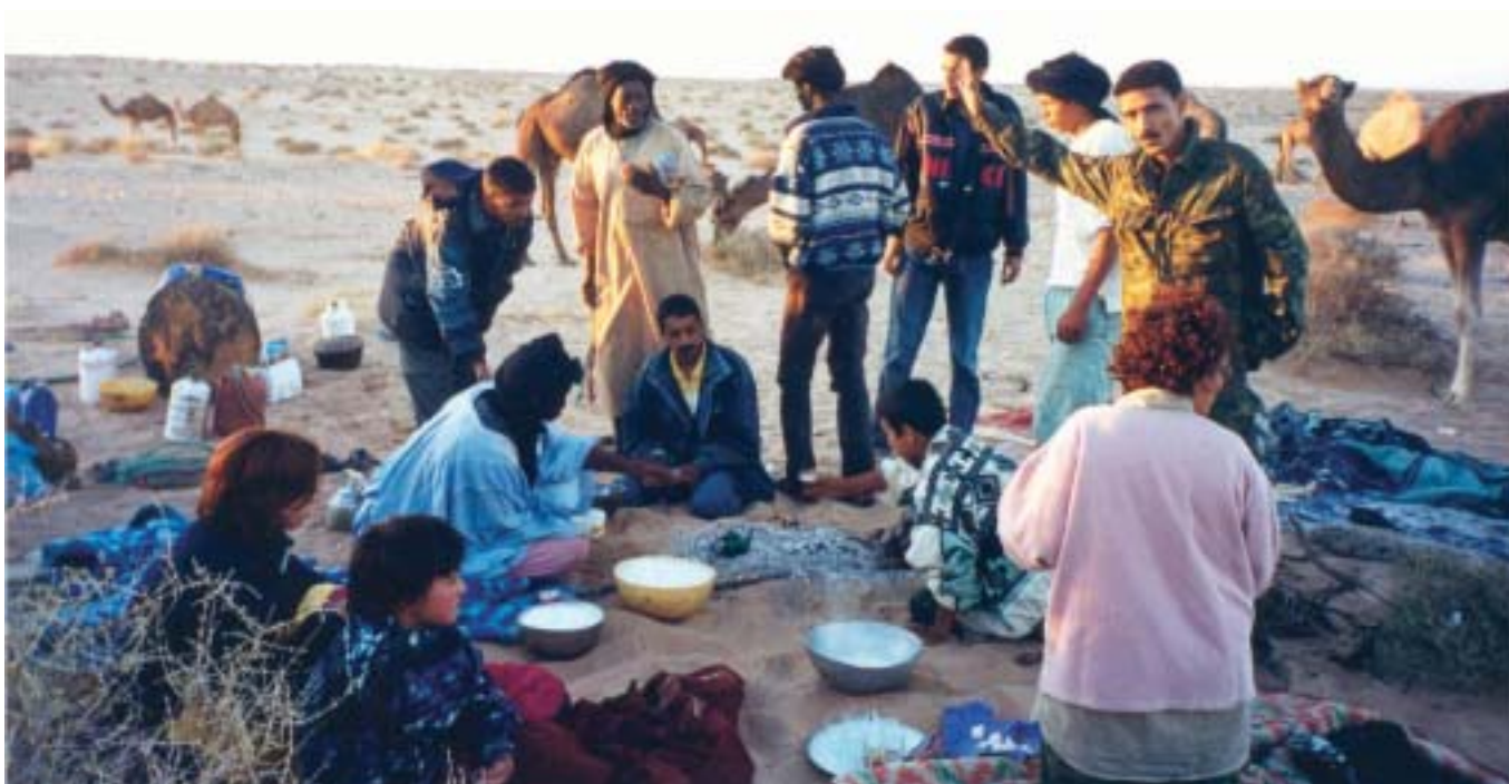
Sahrauís coent menjar en un forn fet a terra.

a acceptar-la (en el cas que s'apliqués una proposta com la dissenyada pel Roberts). És més, com s'acceptaria un moviment que propugnés la independència d'un territori, quan actualment al Marroc la integritat territorial és de les qüestions més sagrades?