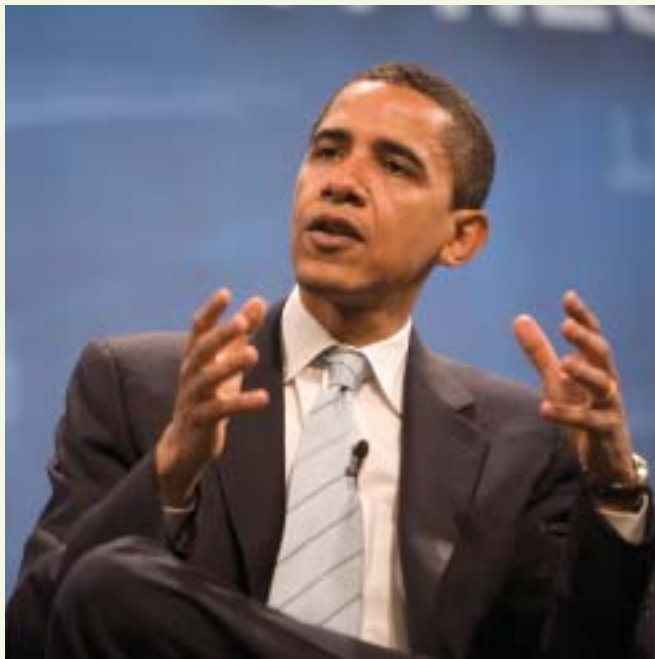
Barack Obama obre una porta a l'esperança.

El Marroc és un aliat estratègic de les grans potències, especialment de França i els Estats Units, que el perceben com a element d'estabilitat a la regió i com a fre a l'integrisme. Aquestes potències bloquegen sistemàticament qualsevol resolució que pugui ser perjudicial pel seu aliat en relació al Sàhara Occidental, ja que un canvi en aquest sentit posar en perill la continuïtat de la monarquia alauita.