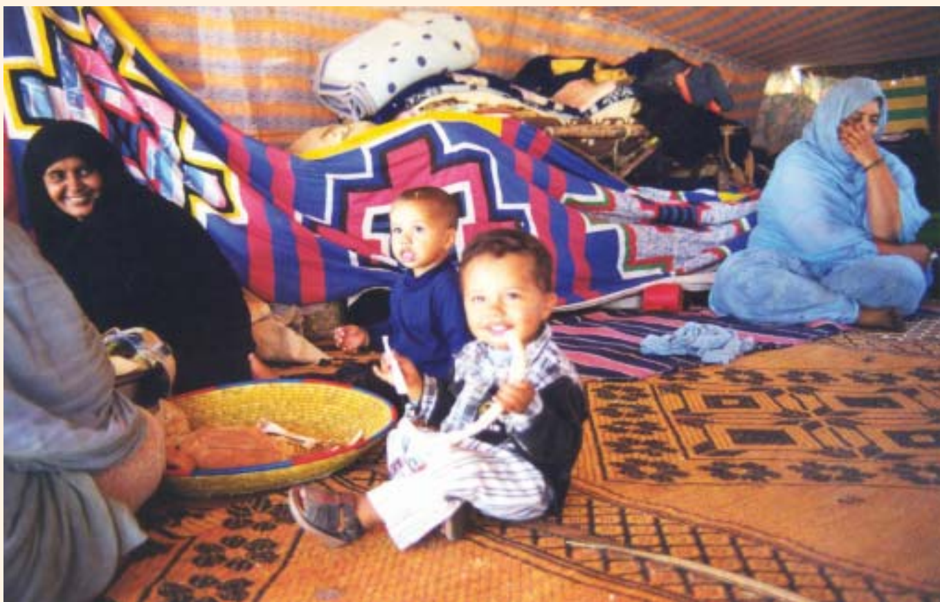
La haima és nucli de l'espai familiar tradicional

ons Unides com a legítim representant del poble sahrauí, va crear la RASD (República Àrab Sahrauí Democràtica). També van crear un exèrcit, l'ELPS (Exèrcit d'Alliberació Popular Sahrauí) que va estar en conflicte obert amb el Marroc des del 1975 fins al 1991 i que va utilitzar una estratègia de guerra de guerrilles, afavorits pel fet que es coneixien com ningú les característiques del territori.